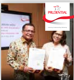
Kerja Sama Jasa Marga