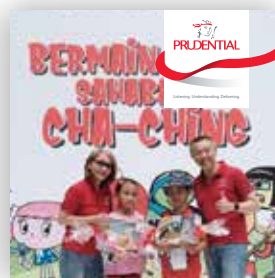
Acara Cha-Ching Bersama Keluarga Nasabah