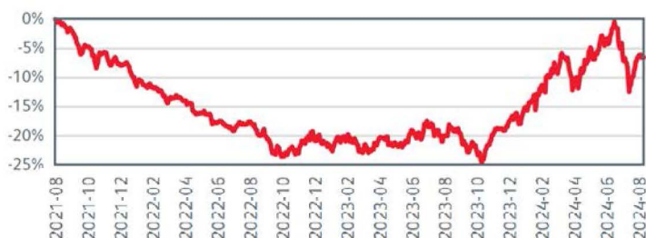
Kinerja Kumulatif - 3 Tahun Terakhir